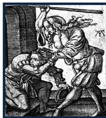
"Femme battant mari" (Durer, XVII Sec.)